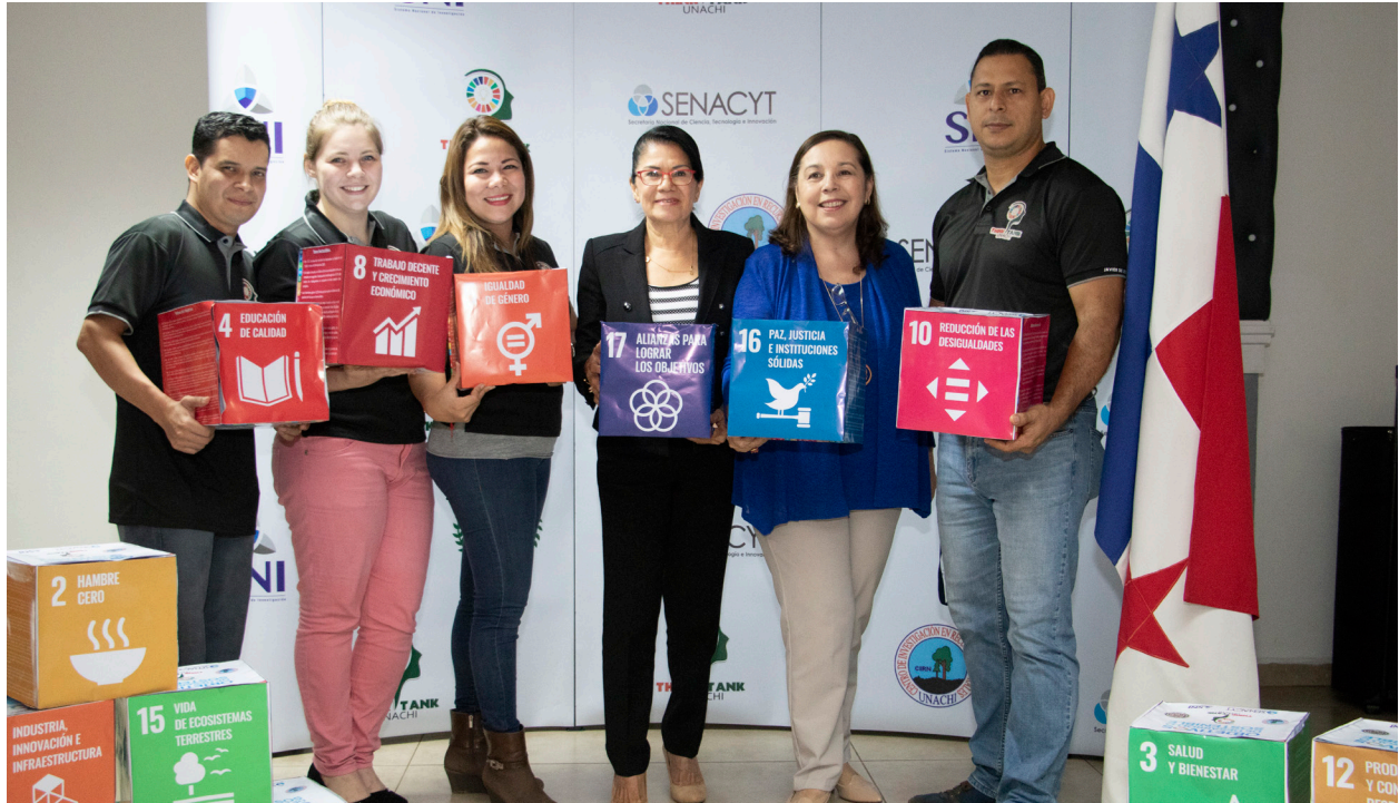
Fig. 1. Equipo Think Tank UNACHI, impulsando los ODS a través del seminario taller Elaboración de Estrategias de Desarrollo Sostenible con los Actores Claves de la Región Occidental de Panamá