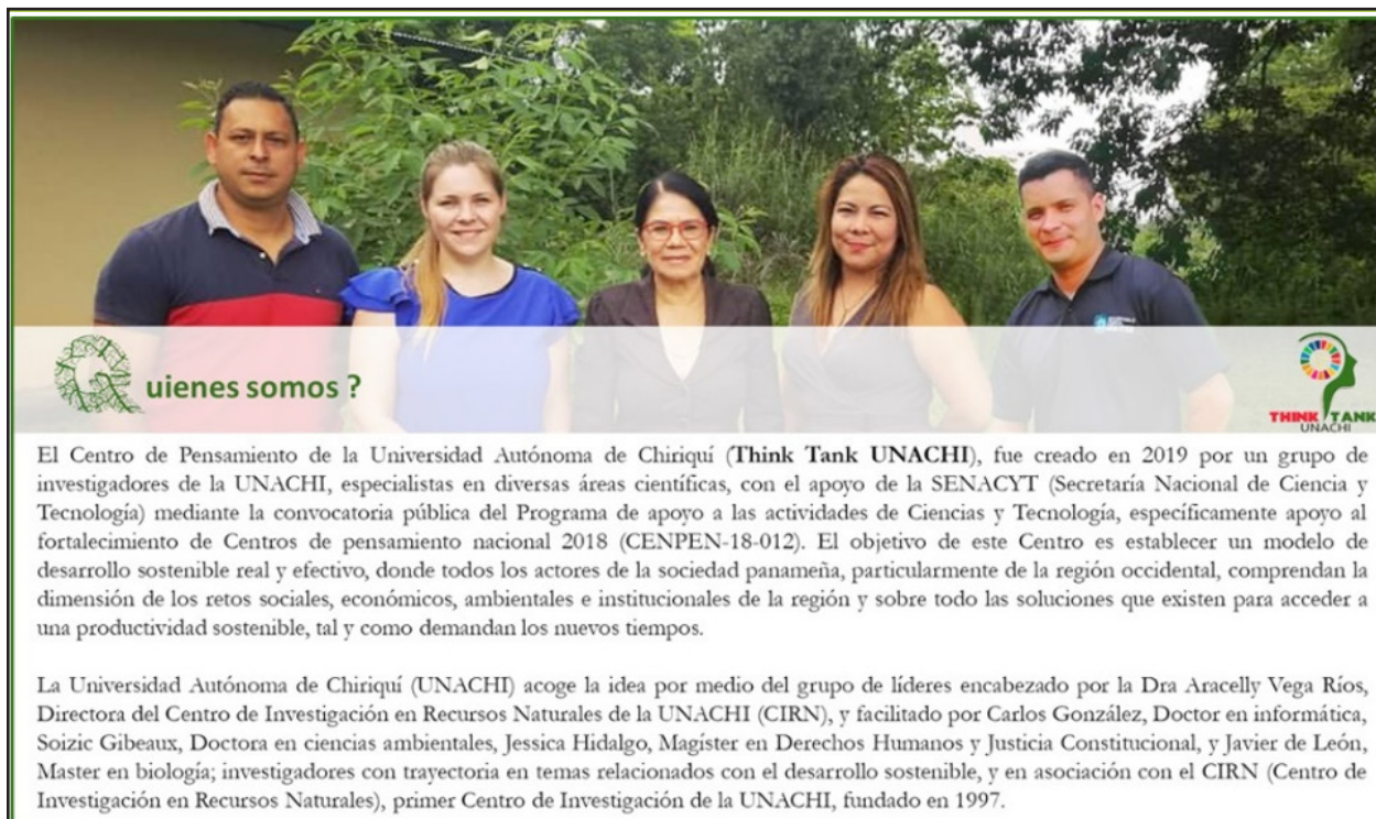
Fig. 2. Presentación del Thinktank UNACHI y su grupo líder.

sólo logran descifrarse por medio de su evaluación nación está conformada por diversas realidades que y estudio individual, y en el caso de la región, su realidad es distinta al resto del país por tratarse de un área de suma importancia para la producción agrícola y pecuaria, que destaca en temas de desarrollo turístico con el importante auge del café a nivel internacional, por lo que estamos llamados a revisar y analizar lo que se ha adelantado en cada uno de éstos sectores y aportar al debate estratégico nacional e internacional, considerando dicha información para la elaboración de políticas públicas para el desarrollo integral de la nación.